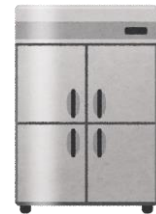
業務用冷凍冷蔵庫 など