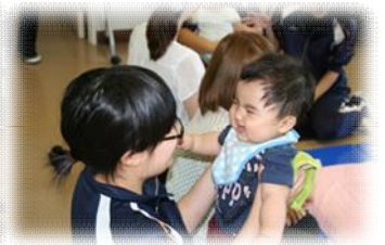
赤ちゃんふれあい体験(高校)