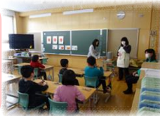
性教育・歯科教室(小学校)