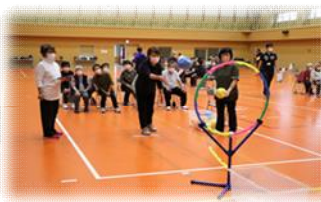
軽スポーツ交流会

・母子各種健診 (乳幼児・1歳6ヶ月・3歳児・5歳児) ・特定保健指導 ・高齢者介護予防訪問 など 様々な保健活動をしています！