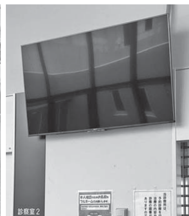
外来待合・ 病棟デイルームのテレビ