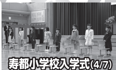
寿都小学校入学式(4/7)