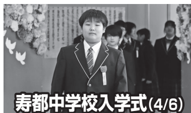
寿都中学校入学式(4/6)