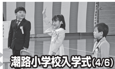
潮路小学校入学式(4/6)