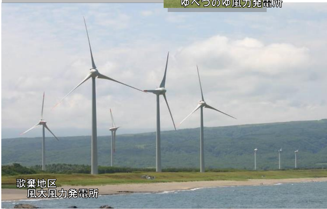
歌棄地区 風太風力発電所