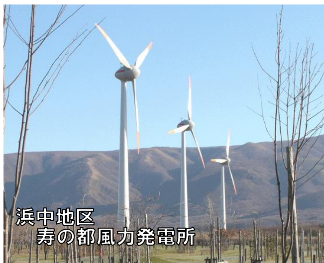
浜中地区 寿の都風力発電所