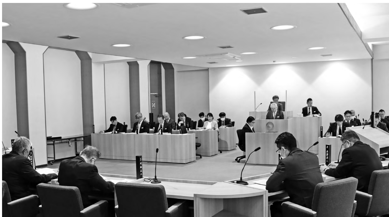
令和8年第1回寿都町議会定例会の様子。