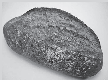
国産小麦のカンパーニュ

表面はパリッと歯切れが良く、内側はしっとりふんわりしたシンプルな食事パンです。ほのかに香ばしい小麦の香りがして、ジャムとの相性が抜群です。