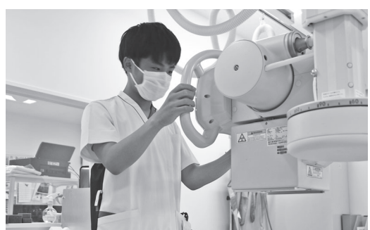
診療所の機械に触れている様子

10月8・9日の2日間、寿都高校2年生が町内外11か所の事業所で職業体験（インターンシップ）を行いました。 町内外の保育園や飲食店、診療所などで、実習先の方々から業務やスキルの指導を受け、生徒は緊張と不慣れな作業に、戸惑いながらも精一杯取り組んでいる様子が見られました。 実際に生徒から「初めての作業でミスが多かった」「改めて興味をもった」「短い時間だが忙しくて大変」「働いている人の凄さを実感した」という声が聞かれました。 今回の体験で学んだことを今後の日常生活や進路活動に活用していただきたいと思います。